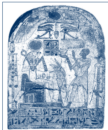
Figure 3. Le soleil « ailé » de l'Égypte ancienne (représentation d'une éclipse solaire totale ?). Peinture sur bois (Louvre).