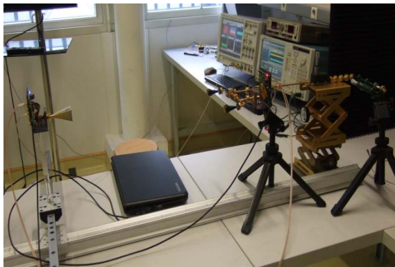
Figure 2. Configuration de mesure.

Pour démontrer, par la simulation et par l'expérience, la faisabilité de cette estimation, un système de communication opérant à 60 GHz (en considérant le canal) est d'abord simulé en utilisant le logiciel SystemVue®, puis testé en utilisant un module d'émission réception fonctionnant à 60 GHz. Dans la figure 1, une configuration de mesure est présentée. En présence du canal, le spectre et la réponse équivalente du canal reçu sont déformés en raison de l'influence des multi trajets. Donc, une régression non linéaire fondée sur la méthode des moindres carrés est utilisée pour avoir une estimation de la réponse équivalente du canal et déduire la périodicité du spectre reçu. Le modèle de Fourier considéré pour cette régression permet d'obtenir, figure 2, une très bonne estimation du spectre qui donnera naturellement une très bonne estimation de \tau .