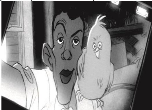
Figure 1. Capture d'écran du clip de Stromae « Carmen ».

Dans une première analyse, « l'oiseau de Twitter » se substitue à « l'oiseau rebelle », censé lui-même métaphoriser l'amour à travers la cruauté de son sentiment. Comme passion, le sentiment amoureux est soumis à une « loi » supérieure qui se présente comme une attraction difficilement résistible, d'autant plus fatale qu'elle peut être réciproque, indirecte ou non partagée : « si tu ne m'aimes pas, je t'aime, prends garde à toi ! ».