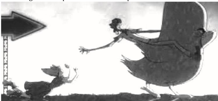
Figure 6. Capture d'écran du clip de Stromae « Carmen »