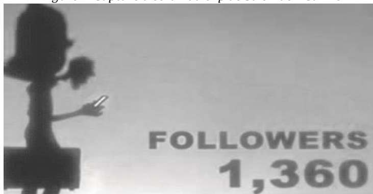
Figure 2. Capture d'écran du clip de Stromae « Carmen ».

La « morale » de la relecture moderne de Stromae est directement communicationnelle. Elle repose sur la nature du trajet affectif pris dans sa plus grande généralité, qui est dorénavant médiatisé par des « réseaux » quantitatifs. La personnification ne porte plus tant sur le sentiment que sur sa mise à l'écran. Le « twitt » devient une monnaie d'échange affectif qui affecte l'ensemble des relations humaines comme le souligne la scène de la relation amoureuse et charnelle du chanteur Stromae avec sa petite amie empêchée par son écran de Smartphone.