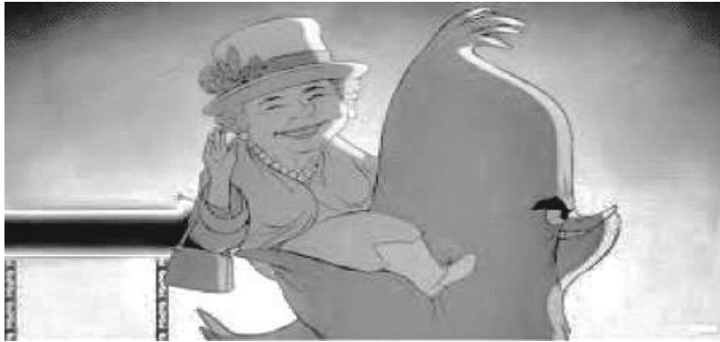
Figure 4. Capture d'écran du clip de Stromae « Carmen ».

Le discours sur les écrans qu'offre ce dessin animé n'est pas seulement intégré à une réflexivité ordinaire sur les usages des individus ; il est redoublé d'une conception sur leur propre vie psychique telle que les nouvelles technologies le leur imposent. Ce clip procède en cela d'une écranalyse explicite.