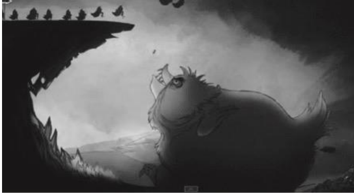
Figure 8. Capture d'écran du clip de Stromae « Carmen ».

La force illustrative de ce clip devient alors édifiante. Elle visualise une autre représentation dominante de la réflexivité propre au concept d'écranalyse : la valeur « stercoraire » des fragments sémiotiques mis en circulation. Cette seconde hypothèse réflexive, qui prend ici une puissance visuelle remarquable, est de l'ordre de ce qu'il nous faut appeler « écranalité ».