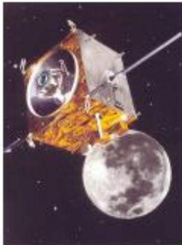
Figure1. EntrySat de l'ISAE, destiné à l'étude du comportement des débris orbitaux 1

Depuis les années 50, de nombreux satellites ont été envoyés dans l'espace, certains habités comme le fut le premier satellite soviétique et telle l'actuelle Station Spatiale Internationale, d'autres non tels les satellites de télécommunication et les nombreux nanosatellites d'aujourd'hui (Figure1). L'intérêt - technique, commercial et scientifique - de la conquête spatiale est fréquemment évoqué dans les médias et donc connu du grand public : météorologie, télécommunications, observation de la terre, astronomie. Notons aussi l'usage militaire.