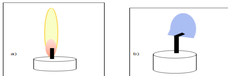
Figure2. Représentation schématique de flammes de bougie observées par Carleton et Weinberg en vol parabolique : a) sous gravité normale (1g), b) en micropesanteur (0g) 2 .