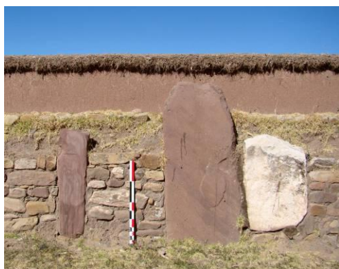
Figura 1, a y b. Vista del patio semi-subterráneo en la cumbre del montículo de Chiripa

Las mismas características parecen organizar las partes adicionales del montículo de Chiripa. Durante los trabajos de excavaciones, varios fragmentos de adobe decorados con motivos pintados fueron también identificados en los sectores periféricos de la cumbre (Mohr-Chávez 1988:19). En la estructura misma de la loma, ahora por parte expuesta, el relleno se compone de varias capas de tierra mezclada, contenidas por celdas hechas a partir de piedras de río