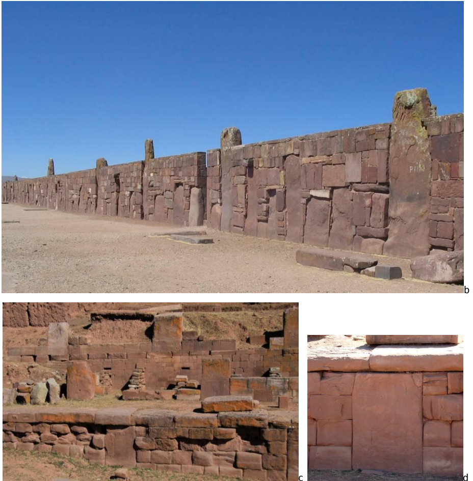
Figura 9. La disposición de los pilares monolíticos en los edificios de Tiwanaku integra totalmente la tradición arquitectural altiplánica. a y b. Vista del patio semi-subterráneo y la delimitación de la plataforma del Kalasasaya; c y d. Muros de contención de la pirámide Akapana

Como lo vemos, los sistemas de plataformas son totalmente integrados en el plan de organización Tiahuanaco. Esta presencia atesta en parte la herencia transmitida por la sociedad Pucara al fenómeno siguiente según un principio de continuidad cultural. Por otra parte, podemos reconocer en las construcciones de Tiwanaku la integración de la forma escalonada definida por las losas arquitectónicas en Pukara. Varios pilares y bloques monolíticos del Kalasasaya y de