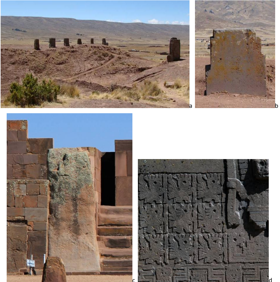
Figura 10. a y b. Encontramos en la arquitectura de Tiwanaku la presencia de muescas heredadas del periodo Pucara, entre otras losas escalonadas en la parte superior de la pirámide Akapana; c y d. Programa de decoración incorporado en la plataforma del Kalasasaya

una resistencia superior a la carga y permite también un trabajo superficial muy fino, proporcionando así al escultor una materia ideal para la integración de toda una variedad de motivos iconográficos con muchos detalles. Por último, la andesita brindó a los expertos Tiahuanaco la posibilidad de hacer un trabajo de precisión.