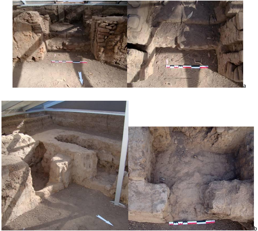
Figura 2. Organización de la entrada (a) y de las celdas (b) en el recinto periférico de Chiripa

A partir del ejemplo bien conocido del montículo de Chiripa, notamos una estrategia bien clara en el tipo y el manejo del material utilizado para la arquitectura de esta época Formativa. Primero, en el caso de los elementos de gran tamaño (como las losas monolíticas), vemos claramente una preferencia casi unánime para rocas de origen sedimentarias tipo arenisca. Son abundantes en la zona geológica del Altiplano, su empleo parece lógico: fácil de trabajar con herramientas rústicas de piedra y resistentes, tienen una densidad inferior a las rocas volcánicas. Así son material ideal para la edificación de estructuras de gran tamaño. Es interesante observar que estos elementos arquitectónicos fueron