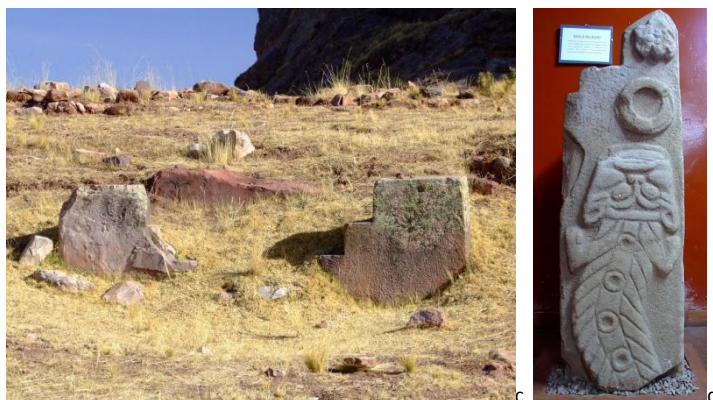
Figura 6, a y b. Composición de los patios hundidos (sector central y sur) en la plataforma superior del Qalasaya; c y d. La estela del “gato de agua” Pucara, conservada en el Museo Lítico de Pucara, presenta las mismas muescas características que las losas monolíticas

Accedemos al nivel superior del Qalasaya de Pucara por medio de una gran escalera monumental. En línea recta, cruza todas las plataformas del edificio desde la parte inferior hasta la cumbre. Esta escalera se compone de grandes piedras rectangulares alineadas para constituir cada peldaño. El material empleado es idéntico a los componentes de los muros arquitectónicos de las plataformas del Qalasaya. Como en Chiripa, las piedras que constituyen los muros de contención de las terrazas (y de los patios hundidos) parecen ser elementos naturales reutilizados. A la diferencia que esta vez, no consisten en cantos rodados, sino en bloques de piedra más importantes extraídos de macizos y peñones. Si la parte exterior de la roca tiene un acabado bien plano, el resto de la forma queda muy rústica, con poco retoque. Únicamente los elementos dispuestos al nivel de las esquinas de las plataformas presentan una talla rectangular bien hecha.