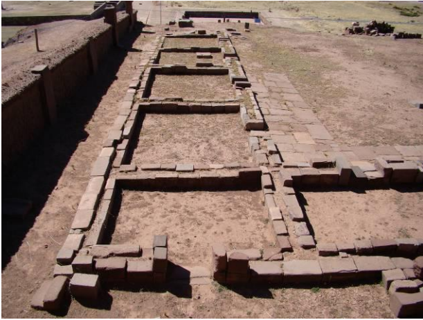
Figura 11. Conjunto de celdas asociado con el patio hundido en la cumbre de la pirámide Akapana (fotografía: F. Cuynet)

La técnica de talla Tiahuanaco conduce a la creación de bloques de diferentes tamaños, pero siempre caracterizados por una ejecución perfecta. En general, los elementos constructivos presentan una forma rectangular, con ángulos rectos y lados planos. Por dispositivos más importantes, la forma del bloque puede variar con la incorporación de muescas o ranuras, pero la realización conserva la norma geométrica del estilo Tiahuanaco. Esa técnica avanzada permitió la creación de una arquitectura realmente monumental, megalítica, durante el periodo del Horizonte Medio en el Altiplano andino. Sin uso de mortero, los bloques monolíticos se ajustan perfectamente. A veces, vemos los elementos encajarse ligeramente a la manera de la futura técnica inca. Agregando grapas de cobre en huellas dedicadas, los arquitectos Tiahuanaco consolidaron las estructuras rituales y los canales. De este modo, los edificios perduraron durante siglos a pesar de los terremotos y de las condiciones climáticas. Todos aquellos desarrollos técnicos condicionaron las características de la arquitectura monumental Tiahuanaco.