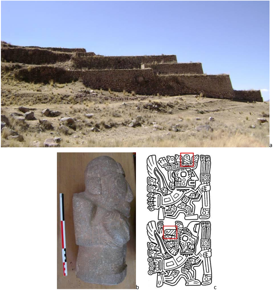
Figura 15, a. Las terrazas sobrepuestas del Qalasaya de Pukara; b. Estatuilla Pucara cargando una concha, Museo Nacional de Arqueología Tiwanaku de La Paz; c. La iconografía Tiahuanaco de la Puerta del Sol denota una importancia de la imagen de la concha, evocando un contacto con el Mar (fotografías y dibujo: F. Cuynet)

Al nivel local, la apropiación de los viejos sitios por el poder siguiente no solo permitió acceder al plan tradicional de distribución, sino también legitimar la nueva autoridad regional situándola en un proceso simbólico de continuidad cultural. En esta lectura, la transmisión arquitectural hace parte del proceso. De esta manera, los dirigentes establecen una afiliación directa entre ellos y los