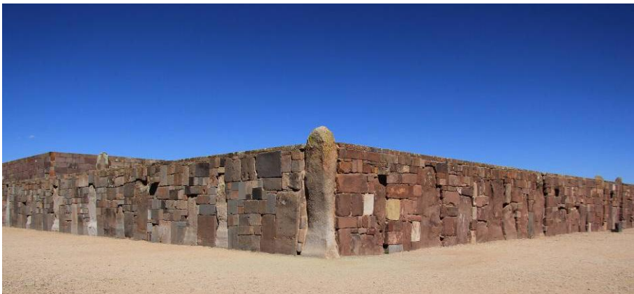
Figura 12, a y b. Las grapas de metal ayudaron en la conservación de los canales y edificios en Tiwanaku; c. Vista de la esquina norte-este de la plataforma del Kalasasaya, con un juego aparente de color