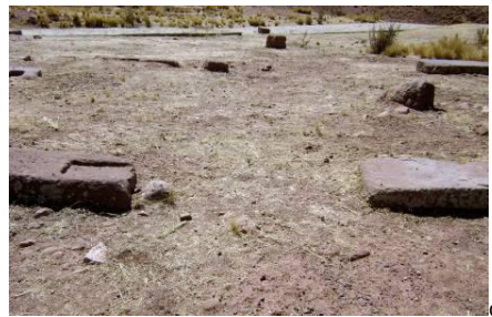
Figura 5, a. El conjunto central de Pukara; b y c. En los conjuntos norte y sur, encontramos indicios reveladores de un posible plan cerrado de los recintos, con sistema de cierre