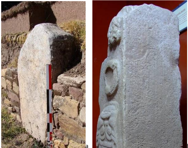
Figura 8 a y b. Tratamiento de las losas monolíticas Chiripa (a) y Pucara (b)

manera de “depredación” definida por el periodo Chiripa. Por otro, los elementos monumentales demuestran un acabado fino. Eso se reconoce más que todo en las áreas ceremoniales de los conjuntos con patios hundidos centrales. En el caso particular de las losas de ornamentación, vemos un tratamiento del elemento arquitectónico muy bien hecho, con líneas rectas y superficies planas. Con una observación más precisa, distinguimos que estas piezas monolíticas fueron esculpidas siguiendo las líneas naturales de sedimentación de la roca. En efecto, como en el proceso de elaboración de las estelas y losas Pucara (Cuynet 2012:188-196), los elementos monumentales integrados en la concepción del Qalasaya fueron extraídos aprovechándose las líneas horizontales de articulación de las capas sucesivas de deposición geológica que presentan los macizos de arenisca. Con esta técnica, es más cómodo extraer un bloque de gran tamaño y su trabajo se revela también facilitado. Esculpiendo la piedra a partir de estas líneas, se puede dar rápidamente al elemento una forma cuadrangular y lados bien planos. Así obtuvieron fácilmente piezas monolíticas bien hechas y resistentes en el tiempo, material ideal para el desarrollo de la arquitectura Pucara.