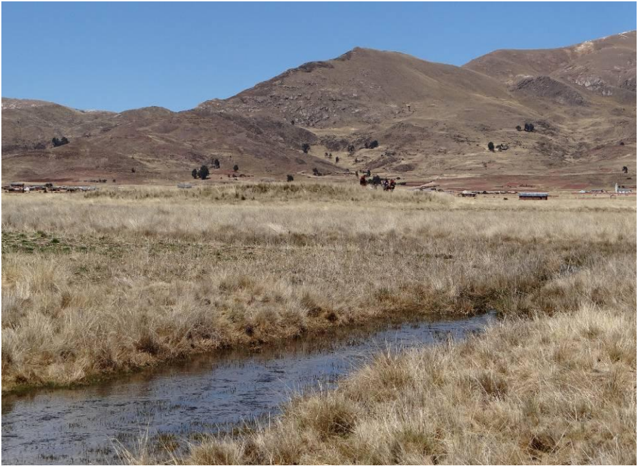
Figura 13. Ubicación del montículo de Wila Pukara en la Pampa de Achaca, rodeado por una laguna artificial

Lo bueno es que esta zona, un poco alejada y desconocida, fue totalmente abandonada poco después del colapso Tiahuanaco, y no conoció las destrucciones relacionadas con las ocupaciones posteriores. De este modo, tenemos acceso en el sector de Pokotia – Wila Pukara a toda la secuencia estratigráfica durante el periodo Tiahuanaco, con las fases de desarrollo y evolución del sitio, perfectamente preservadas. A partir de las excavaciones de la misión de 2014, hemos podido identificar en aquella zona una actividad mixta, similar a la observada por E. Klarich en Pukara, que mezcla contextos ceremoniales con evidencias reveladoras de una producción artesanal. De un lado, la arquitectura observada en la edificación del montículo de Wila Pukara y los tios de cerámicas rituales encontrados en asociación con el momento de actividad de la estructura atestan juntos de la existencia de un conjunto litúrgico