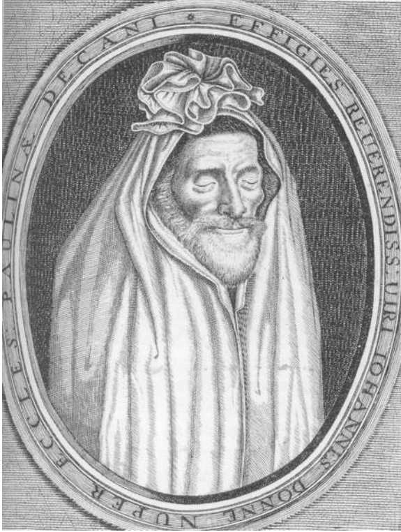
Fig. 3: Frontispice, Deaths Duell, or A Consolation of the Soule, against the dying life, and living Death of the Body (Londres, 1632), gravé par Martin Droeshout.