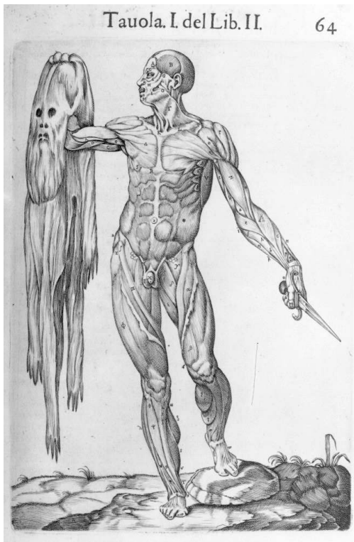
Fig. 2 : Juan Valverde, Anatomia del corpo humano (Rome, 1560), p. 64.