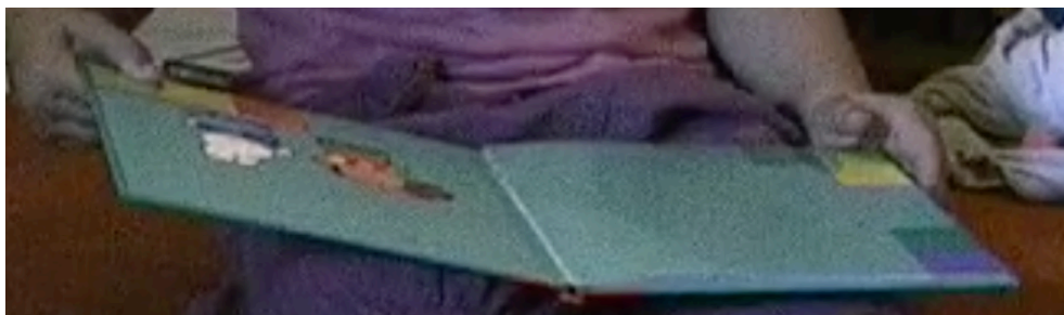
Fig. 3. Image de la double page intérieure du livre "Petit Lapin Blanc dort chez César"