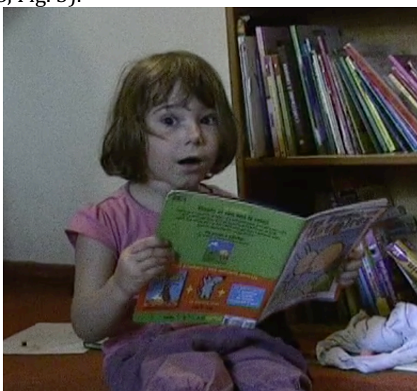
Fig. 5. Lecture expressive

Dans cet extrait, Anaé fait également usage d'une coordination complexe entre actions et productions langagières en proposant une lecture expressive de l'histoire tout en créant des temps d'attente et en dilatant ainsi la structure temporelle des événements décrits. Ce temps d'attente est matérialisé par des allongements de syllabes (« que c'était la nuit ::: ») et l'utilisation de formules propres à la narration bien que non conventionnelles (« et tout un moment »). L'expressivité de la lecture est véhiculée par des montées mélodiques, des contours prosodiques montants descendants (« et tout ↗ un ↘ moment ↗ ») qui sont associés à des mimiques faciales comme les haussements de sourcils et la mimique de surprise exprimée par la bouche en forme de O quand elle dit « et petit soleil roula ! » (1.58, Fig. 5).