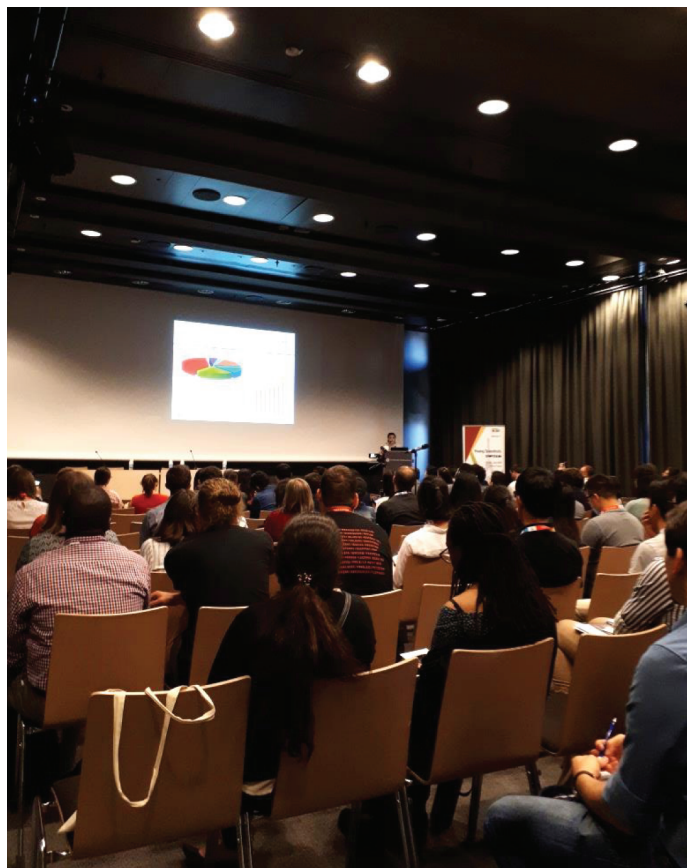
Figure 1 - Le symposium « Jeunes chimistes » au Palais des congrès.