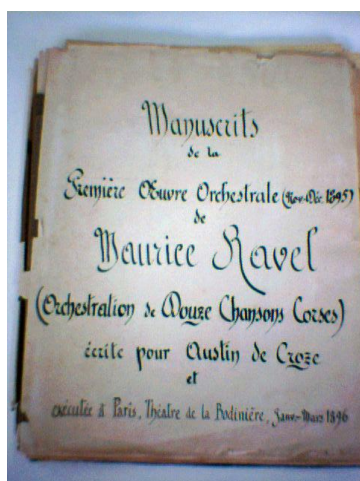
Ex. 1 : Page de couverture 5 , Manuscrit Ravel

A leur suite, Austin de Croze 2 , enthousiasmé par la Corse qu'il découvrit à l'occasion de son service militaire, décida de partir à la recherche des chants populaires de l'île, entre 1885 et 1888. Avant d'écrire son anthologie des chants corses 3 , il donna à Paris, au théâtre de la Bodinière, un certain nombre de conférences sur le sujet en janvier, février et mars 1896. Dans le but d'illustrer musicalement ses conférences et afin, sans doute, d'atténuer, pour le public parisien, la (relative) sécheresse du chant monodique corse, il décida de présenter ces chants de manière harmonisée et orchestrée, travail dont il confia la réalisation à Maurice Ravel 4 . Ces arrangements représentent le premier exemple connu d'orchestration du compositeur.