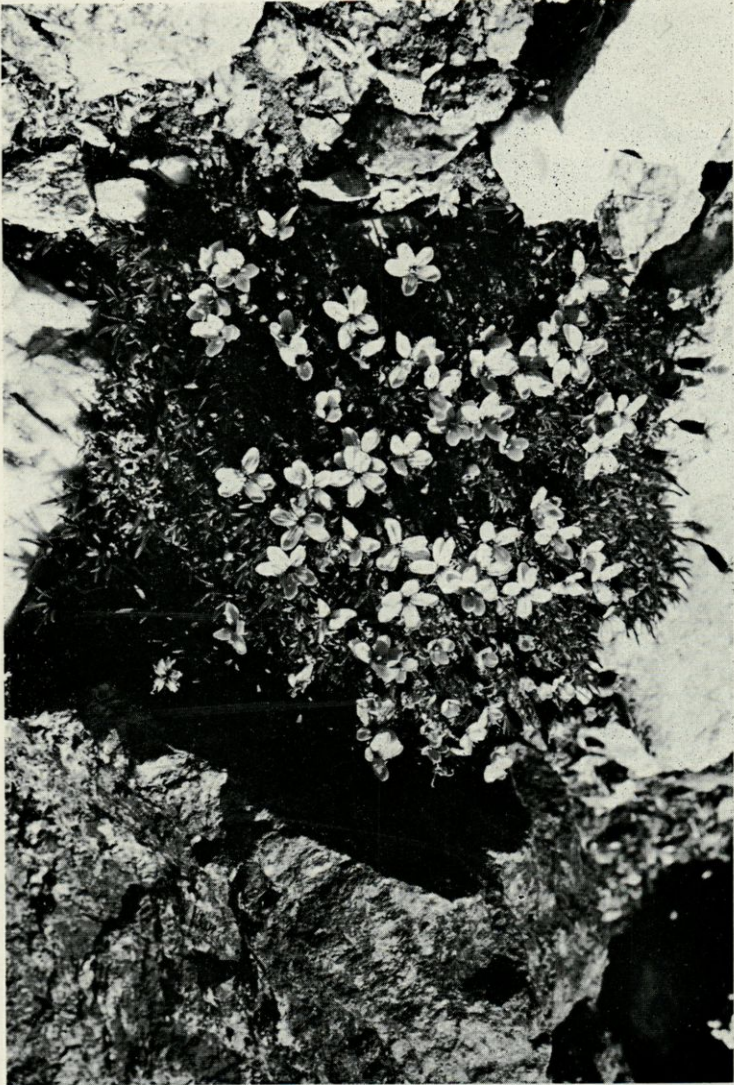
PLANCHE IV. — Silene acaulis L. var. elongata D.C.