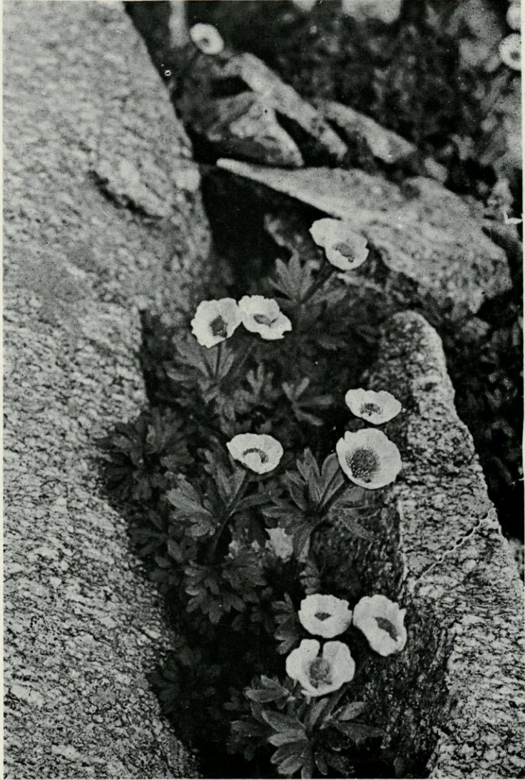
PLANCHE II. — Ranunculus glacialis dans la rocaïlle au pied du Pic de l'Enfer.