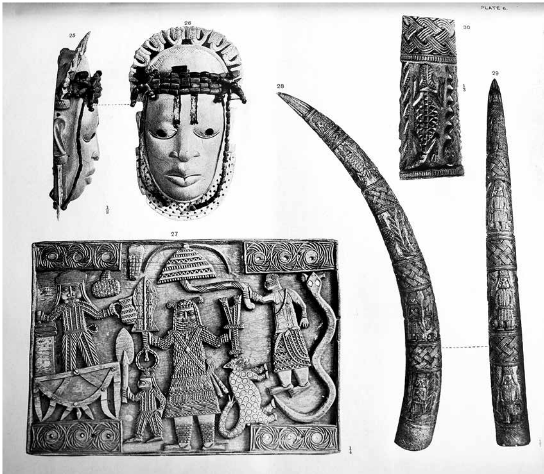
2. Antique Works of Art from Benin , Londres, Printed Privately, 1900, pl. 6.

Ce n'est guère un hasard, ainsi, si le consul-général Ralph Moor (1860-1909), qui dirigea les opérations pour l'administration du Protectorat et qui était responsable de la redistribution des objets entre les officiers, s'appropriâ les deux masques les plus