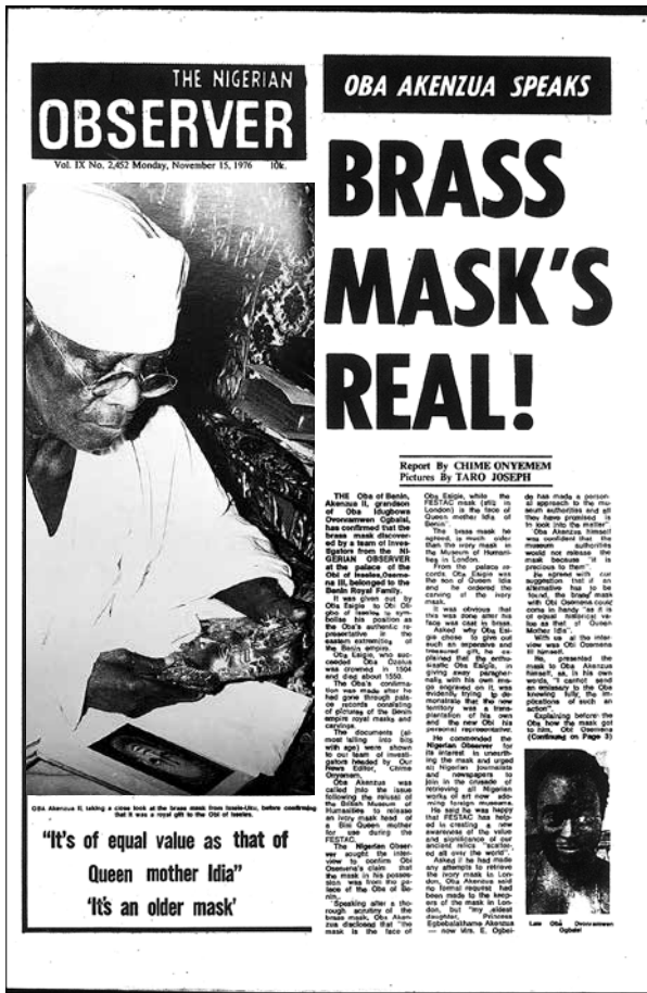
1. La une de The Nigerian Observer , 15 novembre 1976, avec une photographie de Taro Joseph, Akenzua II tenant un masque-pendentif en laiton , 1976.

qui semble être de la main d'un employé du musée, l'auteur anonyme demande : « Pourquoi viser la Grande-Bretagne 3 ? » En effet, il souligne l'existence d'autres belles collections d'objets de Benin City ailleurs et mentionne Berlin et la Russie avant de poursuivre : « Le masque de Bénin n'est pas unique : il en existe deux très semblables en mains privées ; un autre au Museum of Primitive Art à New York. Le gouvernement nigérian ne pourrait-il pas essayer d'en racheter quand ils arrivent sur le marché 4 ? » Il considère visiblement que ces objets sont plus ou moins interchangeables et suggère, non sans une certaine dose de mauvaise foi, que d'autres versions du masque sont peut-être en meilleur état et mieux adaptées au voyage. Il semble ignorer par ailleurs l'existence d'un cinquième masque, qui se trouvait en 1976 au Linden Museum à Stuttgart.