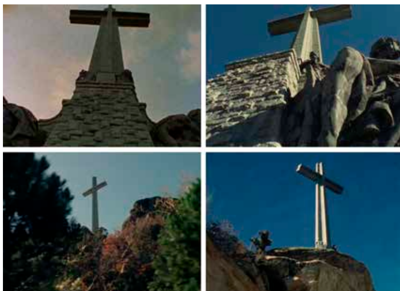
Imagen 5: La verticalidad radicalizada