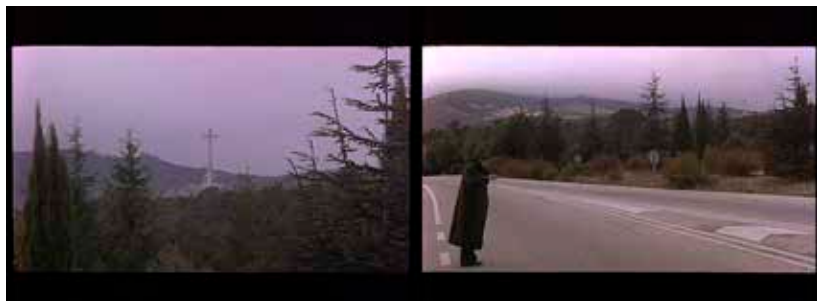
Imagen 3: Bajando del Valle de los Caídos