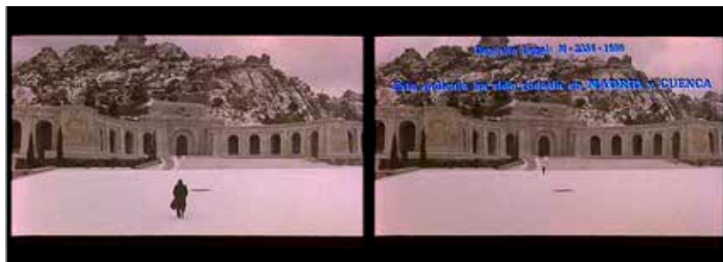
Imagen 4: Retorno al Valle de los Caídos