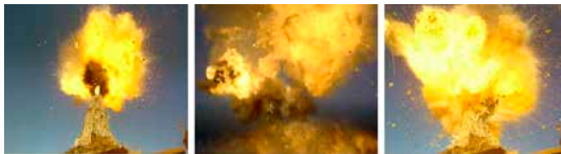
Imagen 8: La verticalidad pulverizada