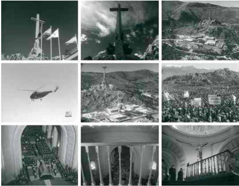
Imagen 1: La verticalidad plasmada en el discurso audiovisual oficial