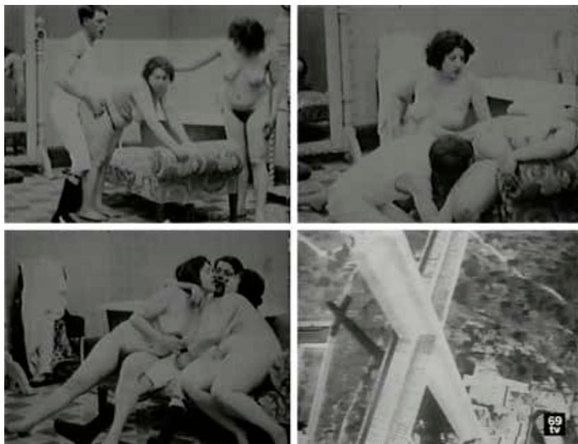
Imagen 6: Profanando la verticalidad