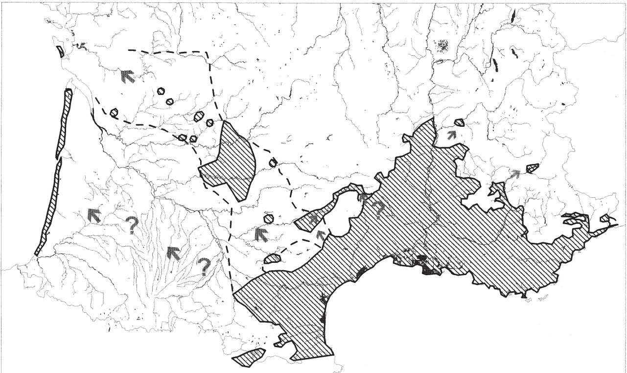
Fig. 2. – Aire de distribution schématique du Lézard ocellé en France (zone grisée). Les flèches indiquent le sens probable de la colonisation.

Schematic distribution of the jewelled lizard in France (grey zone). Arrows indicate the probable direction of colonisation.