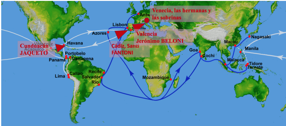
Fig. 7. El viaje del dinero de Marcos Juan Jaqueto entre China y Sevilla 18 .

En realidad, los circuitos mercantiles de Marcos Juan eran los circuitos habituales, las tradicionales rutas que aparecen en este mapa: Manila / China; Acapulco / Veracruz; Sevilla / Europa.