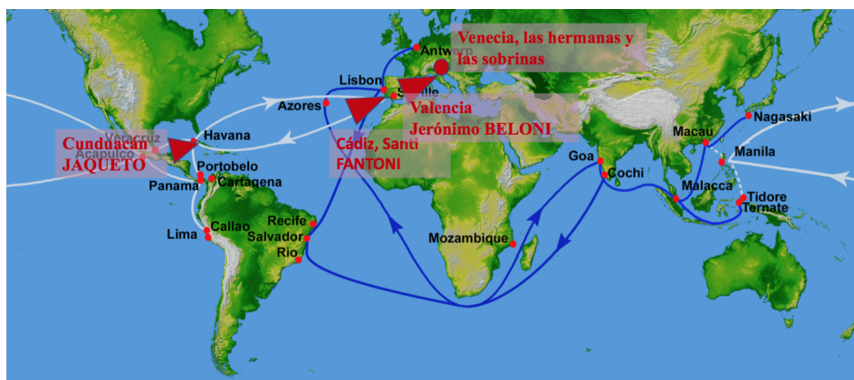
Fig. 7. El viaje del dinero de Marcos Juan Jaqueto entre China y Sevilla 18 .

En realidad, los circuitos mercantiles de Marcos Juan eran los circuitos habituales, las tradicionales rutas que aparecen en este mapa: Manila / China; Acapulco / Veracruz; Sevilla / Europa.