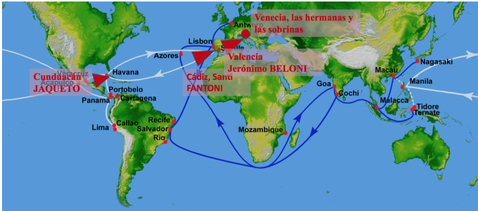
Fig. 7. El viaje del dinero de Marcos Juan Jaqueto entre China y Sevilla 18 .

En realidad, los circuitos mercantiles de Marcos Juan eran los circuitos habituales, las tradicionales rutas que aparecen en este mapa: Manila / China; Acapulco / Veracruz; Sevilla / Europa.