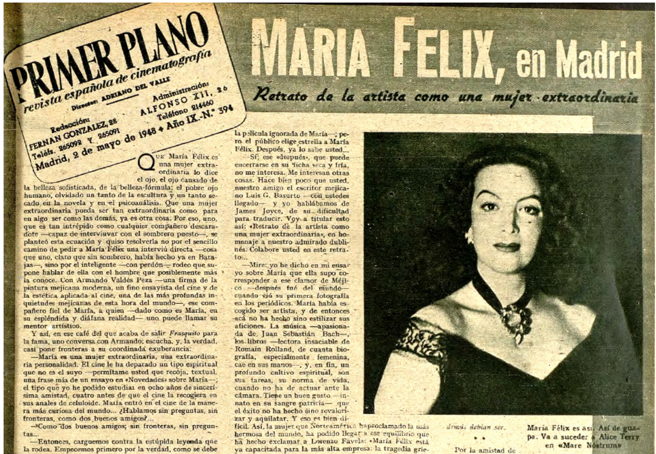
Figura 5. — Artículo Primer Plano 44 .

que debe haber en toda película española, y que tantas veces hemos echado de menos 46 .