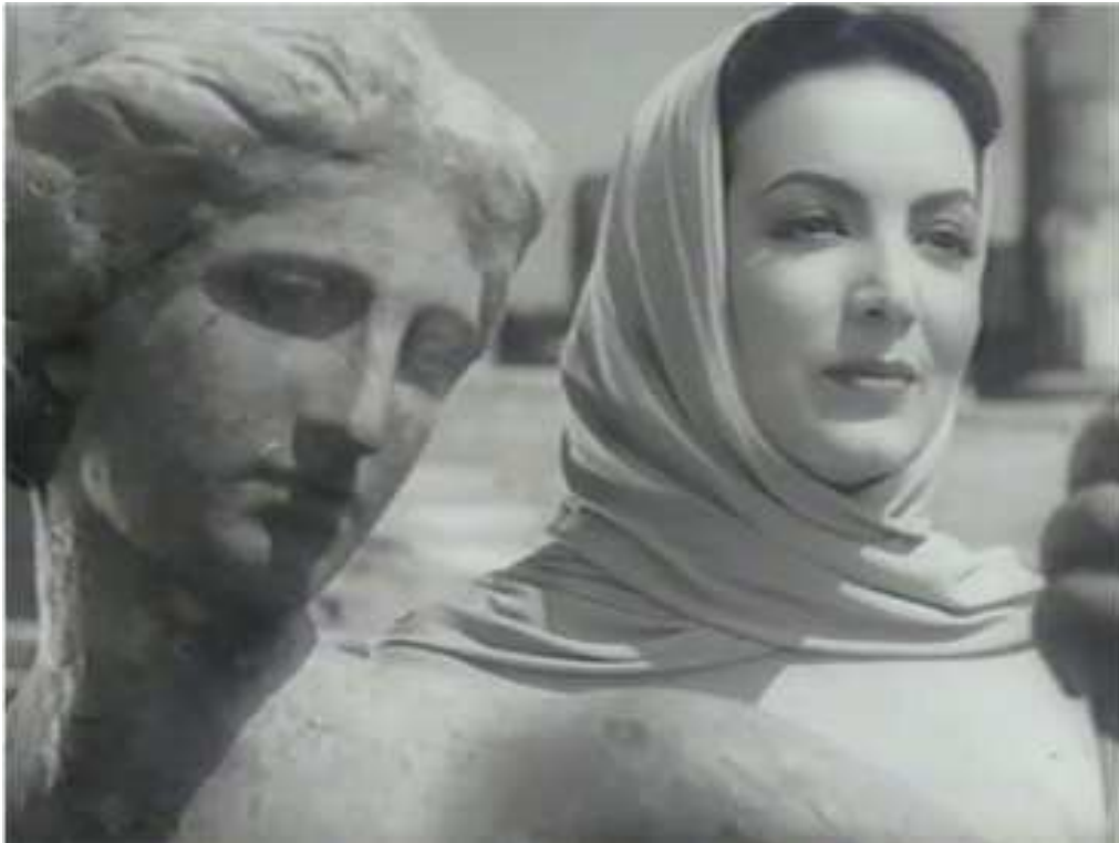
Figura 2. — Anfitrite.

Anfitrite (la mujer de Poseidón) que reina sobre los monstruos marinos y a la que se ve asociada mediante el recurso clásico en el cine de la utilización de una estatua cuyo parecido sobrecoge a Ulises y, por otra parte, la de Freya, diosa del amor y de la belleza, pero también de la guerra, en la mitología escandinava —la primera de la Valkirias. Este origen también remite a un imaginario pagano mágico, opuesto al nacional-catolicismo del franquismo de la época.