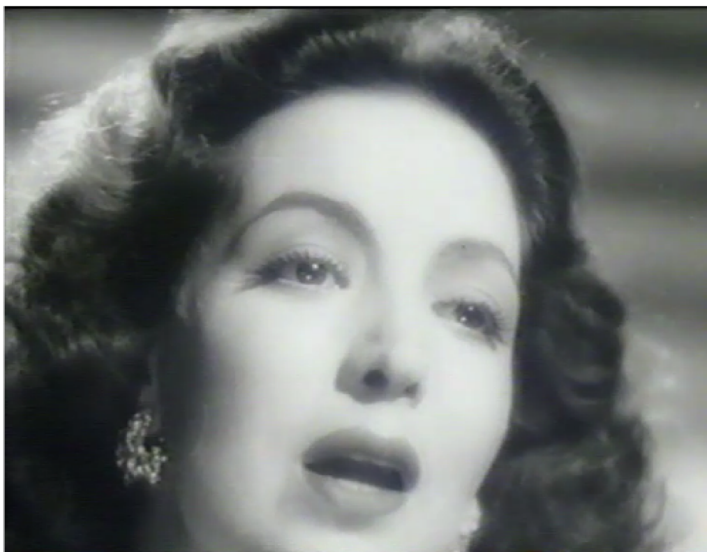
Figura 4. — La Sirena.

El héroe aparece por consiguiente como la víctima de un hechizo, la belleza de la mujer lo ciega, su canto, evocación auditiva del deseo sexual, lo persigue. Preso de alucinaciones acústicas y visuales, en definitiva aparece poseído por la mujer fatal. La canción Te quiero besar , interpretada por la voz dulcísima de la cantante Ana María González 27 , quien adapta su registro de soprano al timbre más grave de María Félix, convierte literalmente a la mujer en sirena en una secuencia emblemática del carácter diabólico del control que ejerce Freya sobre Ulises. La desrealización de la puesta en escena, la poca profundidad de campo, el montaje en campo contracampo con primeros planos de los dos protagonistas, la iluminación que exacerba la sensualidad de la estrella y la desaparición de cualquier ruido exterior, convierten a la mujer en un ser sobrenatural, sirena y maga, traduciendo filmicamente el hechizo del que es víctima Ferragut, irresistiblemente atraído por Freya. Esta secuencia será el desencadenante de la perdición del héroe en la narración. A diferencia de Ulises en la Odisea , cede a la tentación fatal de la sirena y se convierte en un traidor por ella.