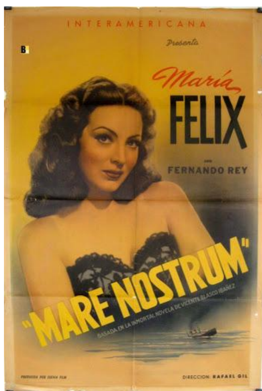
Figura 1. — Cartel de la película Mare Nostrum .

Este truco ilusionista se realiza mediante el personaje de la mujer fatal, de la vampiresa, sobre la cual recae la responsabilidad entera de la tentación, cuando el ejemplar Ferragut consigue redimirse de su pecado, liberado, por la narración y la puesta en escena, de cualquier responsabilidad en el asunto.