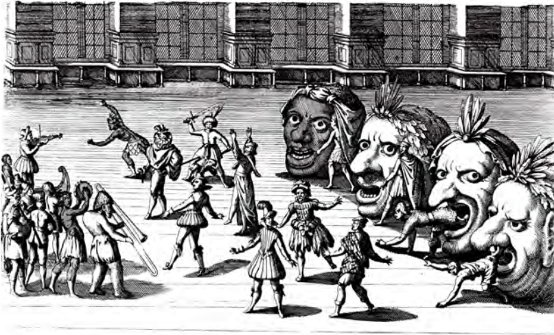
Abbildung 1: Kopfballet

als ballet . 19 Ein paar Jahre vorher, 1634, war in Dänemark bei der von Mara Wade untersuchten, fürstlichen „great wedding“ 20 ein ballet mit gleich lautendem Stoff und Titel aufgeführt worden, auch bereits unter Schütz' Mitwirkung. Am 26. März 1645 ließ der Kaplan des französi-