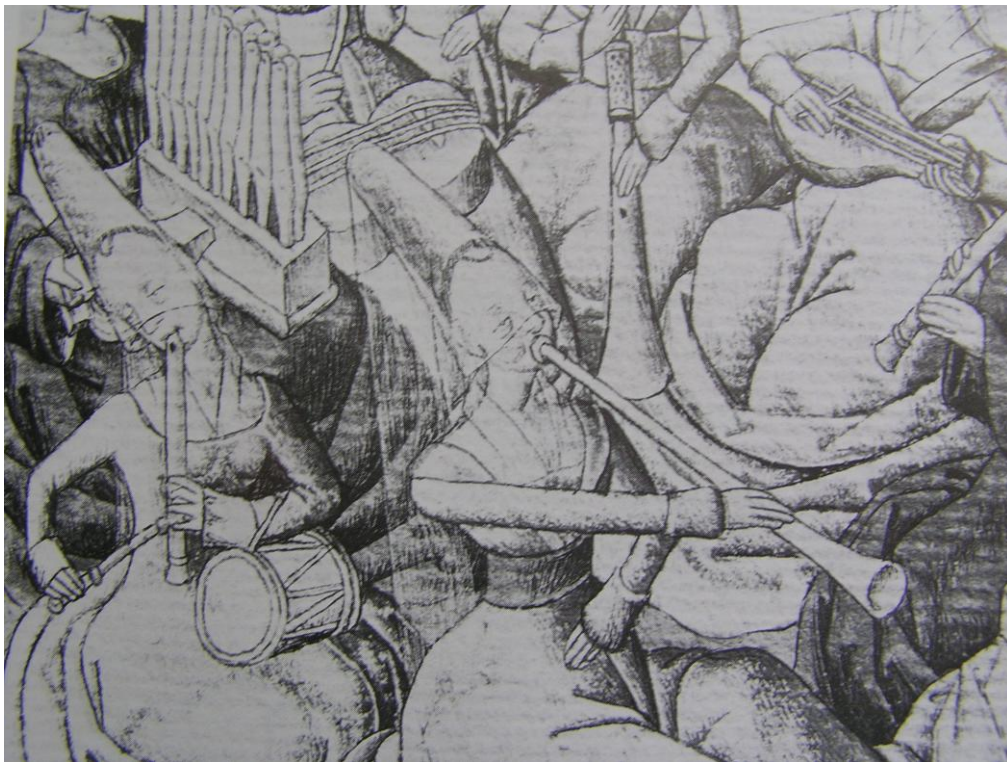
Ill. n°8 : Champion de Dames de Martin le Franc, Grenoble, Bibliothèque Municipale, ms. 875, f°365.

entendus à la cour de Savoie se produisent en 1396 53 . Or, ce n'est plus le cas dans les statuts des villes des provinces françaises qui sont proclamés plus d'un siècle plus tard. Dans les statuts de la ville d'Amiens approuvés le 21 octobre 1465 54 , sont concernés les « maîtres et compagnons de l'estat et science de ménestrandie tant hault comme bas instrumens » et il n'est plus question de « menestrelles » dont on ne trouve pas de trace dans les archives municipales. Cette tendance à la diminution du nombre des femmes dans les corporations des musiciens au XIV e et XV e s'accroît comme le confirme Maria Coldwell dans son article Jouglersses and Trobairitz 55 , même si la compagnie des musiciens de Londres fondée en 1472 accueille encore des femmes. Luc Charles-Dominique explique que « lorsque le métier de jongleur évolue vers celui de ménestrier à partir du XIV e siècle la pratique instrumentale se masculinise en même temps qu'elle évolue vers un instrumentarium monodique haut » 56 . Et très rares sont les représentations de femmes jouant les hauts-instruments comme sur cette miniature du Champion de Dames de Martin le Franc (XV e siècle).