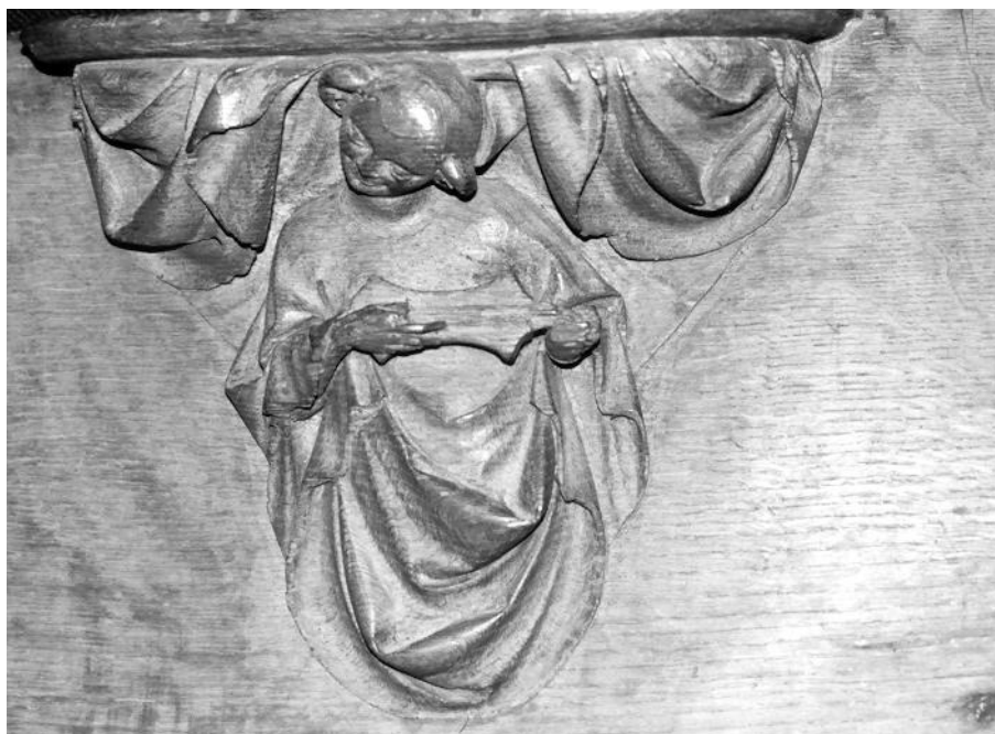
Ill. n° 4 : Miséricorde des Stalles de Cologne – Allemagne

De cette miséricorde des stalles de Cologne (c. 1310) représentant une joueuse de citole (ill.4), émane une impression de douceur, de féminité et d'intériorité face à la puissance des viéleurs et des hybrides clocheteurs des stalles voisines.