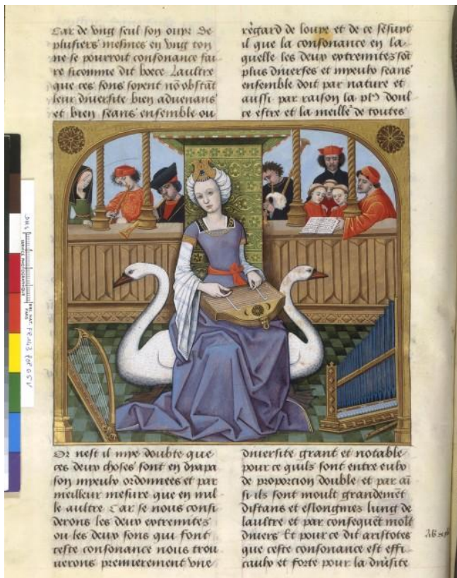
Figure allégorique de Lédà entourée de cygnes (Ill. n°5)

Des Eschez amoureux et des echez d'amour (c. 1500)