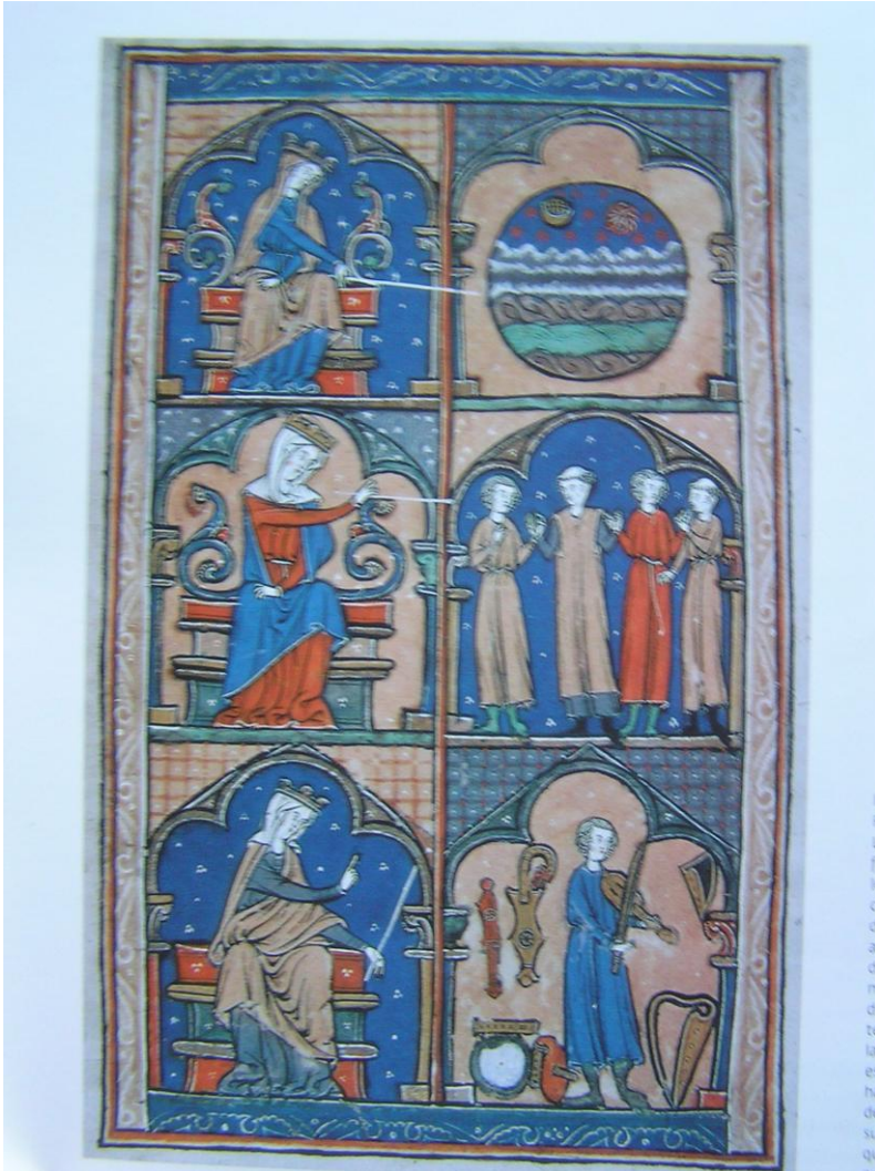
Ill. n°1 Liber magnus organi , Notre Dame de Paris, XIII e siècle. Florence Biblioteca Laurentiana, ms. Plut. 29, f°29.

manuscrits (ill. n°1). Dans une des miniatures du Liber magnus organi , où sont copiées les polyphonies de l'école Notre-Dame de Paris apparaissent les trois catégories de musique selon Boèce sous l'aspect de femmes majestueuses : Musica Mundana , Musica humana et Musica instrumentalis . Munie de la fêrule, Musica instrumentalis au registre du bas, rappelle aux musiciens l'importance de l'enseignement.