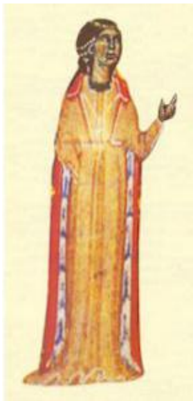
Ill. n° 3 : Beatriz de Dia . Bibliothèque Nationale, Ms cod. fr. 12473, XIII e siècle

Les manuscrits nous permettent de connaître vingt femmes troubadours – trobairitz - et un peu moins de « trouveresses ». Beaucoup moins que d'hommes qu'elles peuvent cependant affronter dans les jeux-partis ou tensos 17 dans le cadre très réglementé de l'amour courtois. Dans son Ensenhamen de la donsela (L'éducation des filles) , le catalan Amanieu de Sescars (c1278–1295) explique que les trobairitz écrivent des jocs partis d'un haut-niveau intellectuel. Les noms de Marie de Ventadorn, Tibors, la sœur de Raimbaut d'Orange et femme de Bertrand de Baux et bien d'autres attestent le rang aristocratique très élevé de ces femmes poètes et chanteuses. Il ne reste malheureusement qu'une seule chanson de trobairitz 18 avec la notation musicale : la chanson A chantar m'er de so que no volria 19 attribuée à l'énigmatique Comtessa de Dia (c. 1140 – 1175) supposée être la femme de Guillem de Poitiers.