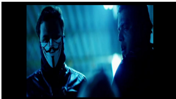
Figura 1. El Chino y Pancho contemplando una víctima borrosa. López, 2014, 1h10m45s