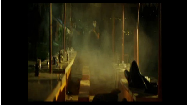
Figura 3. Nubes de humo para las explosiones. López, 2014, 1h06m22s