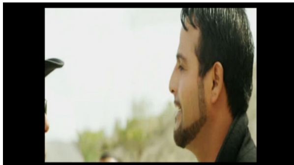
Figura 6. Nariz y sombrero en el encuadre. López, 2014, 17m48s