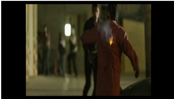
Figura 4. Chispas para los disparos. López, 2014, 1h28m20s