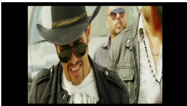
Figura 5. Oreja en el encuadre. López, 2014, 16m03s