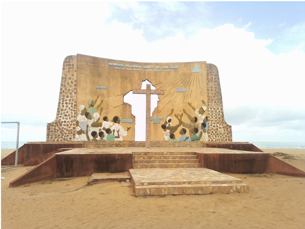
Photo 6. Lieu de commémoration de l'esclavage en 2000.

Le jubilé 2000 de la commémoration de l'esclavage marque un tournant décisif dans la célébration de cet événement. Ce monument marqué par le dessin de la carte du Bénin, elle-même traversée par une croix, symbolise le lien entre la diaspora afro-américaine et le Bénin dans cette commémoration de sorte que la spiritualité occupe une place de choix lors de cet événement. Il faut rappeler que plusieurs marches ont été organisées à Ouidah en mémoire des esclaves. À titre d'exemple, l'Institut du Développement et d'Études Endogènes (IDEE) organise chaque année la marche du repentir entrecoupée de recueils sur la Route de l'Esclave. Depuis le 18 janvier 1998, la société civile de la ville de Ouidah organise chaque année la « Marche et Cérémonie du Repentir » car, le mouvement qui a initié cette marche se veut un « Mouvement pour le Repentir, le Pardon et la Réconciliation ». En définitive, cette initiative est une forme d'appropriation de la mémoire de l'esclavage. Quelle trajectoire les visiteurs initiés et les candidats à l'initiation empruntent-ils à Ouidah ?