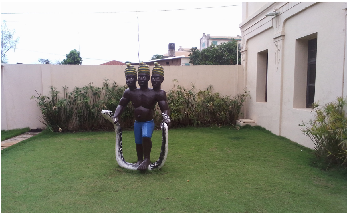
Photo 2. Mami Wata à la Fondation Zinsou. Source : Augustin Amadoudji, mai 2021