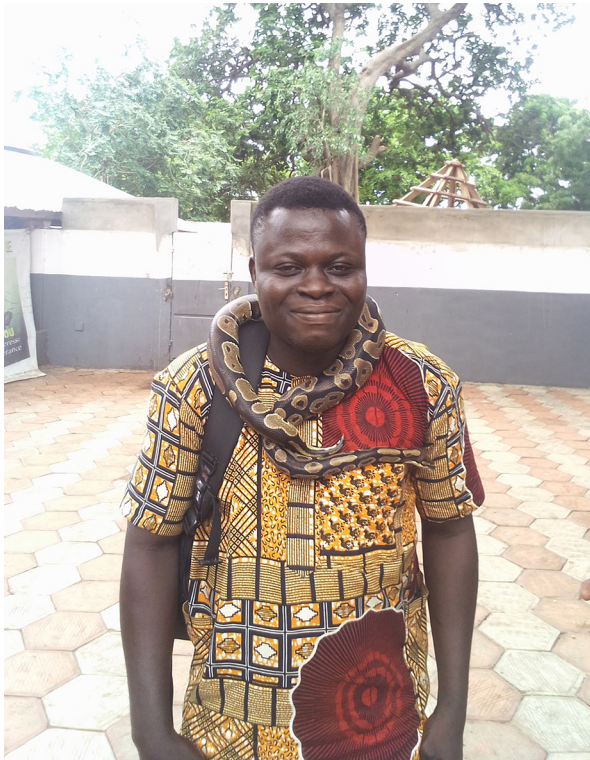
Photo 4. Visiteur au Temple des Pythons. Source : Augustin Amadoudji, mai 2021

ner sept fois et les hommes neuf fois avant leur départ. Cette étape marque la fin de leur séjour sur leur terre natale.