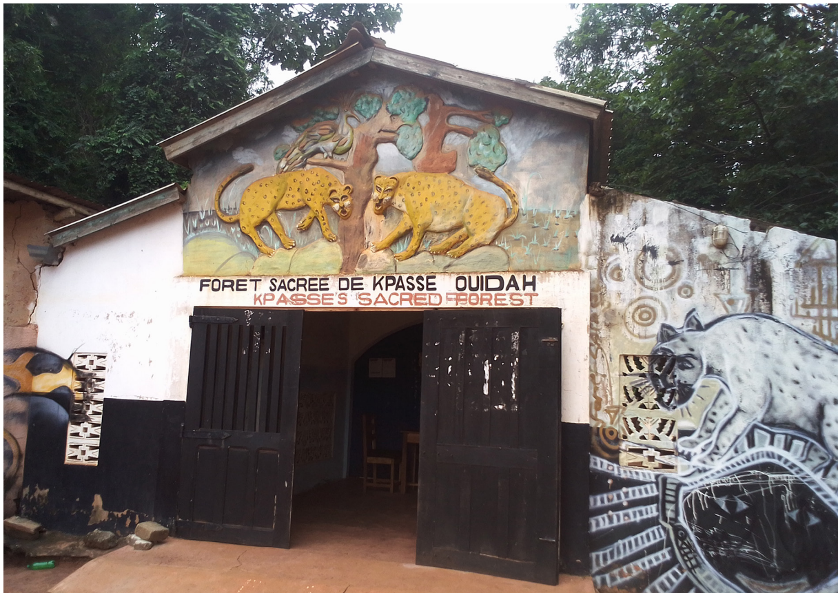
Photo 1. Entrée de la forêt sacrée de Kpassé. Source : Augustin Amadoudji, mai 2021