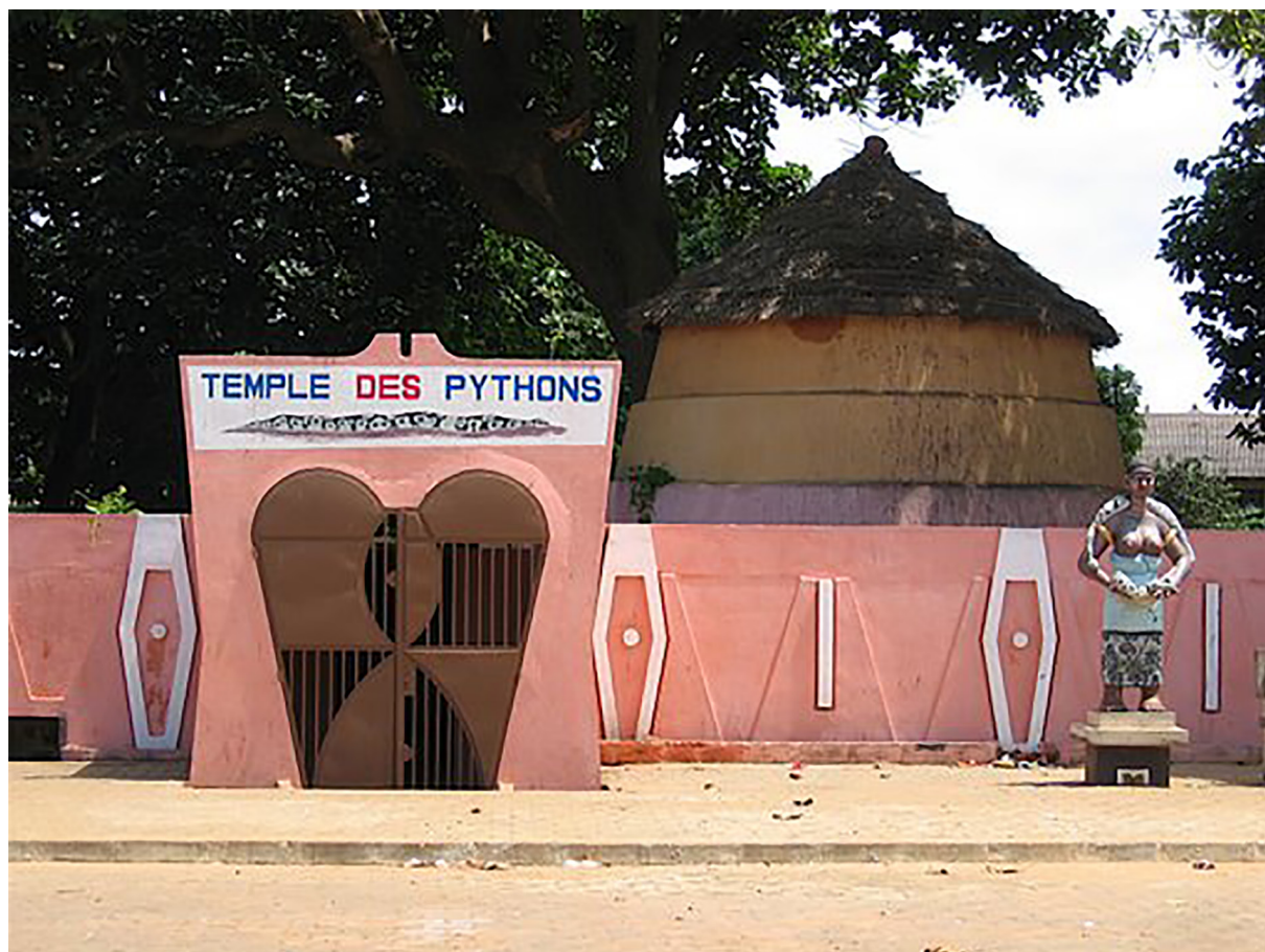
Photo 3. Entrée du Temple des Pythons. Source : Augustin Amadouji, mai 2019

La place Zomachi , symbole de la lumière, est une initiative de la société civile de la ville de Ouidah. Il faut noter que la Route de l'Esclave est un véritable parcours spirituel et initiatique pour les habitants de Ouidah et la Diaspora afro-américaine. Elle rappelle les lieux de douleur vécue au cours du trajet et les dieux des esclaves. Elle est la matérialisation de cette mémoire à travers l'instauration d'un circuit mémoriel à Ouidah. Ouidah était, en effet, un ancien port négrier portugais au XVIII e siècle, l'un des principaux centres de vente et d'embarquement d'esclaves dans le cadre de la traite occidentale (ou traite atlantique). Il faut aussi rappeler sur cet itinéraire la présence de l'arbre de l'oubli que les femmes esclaves devaient contour-