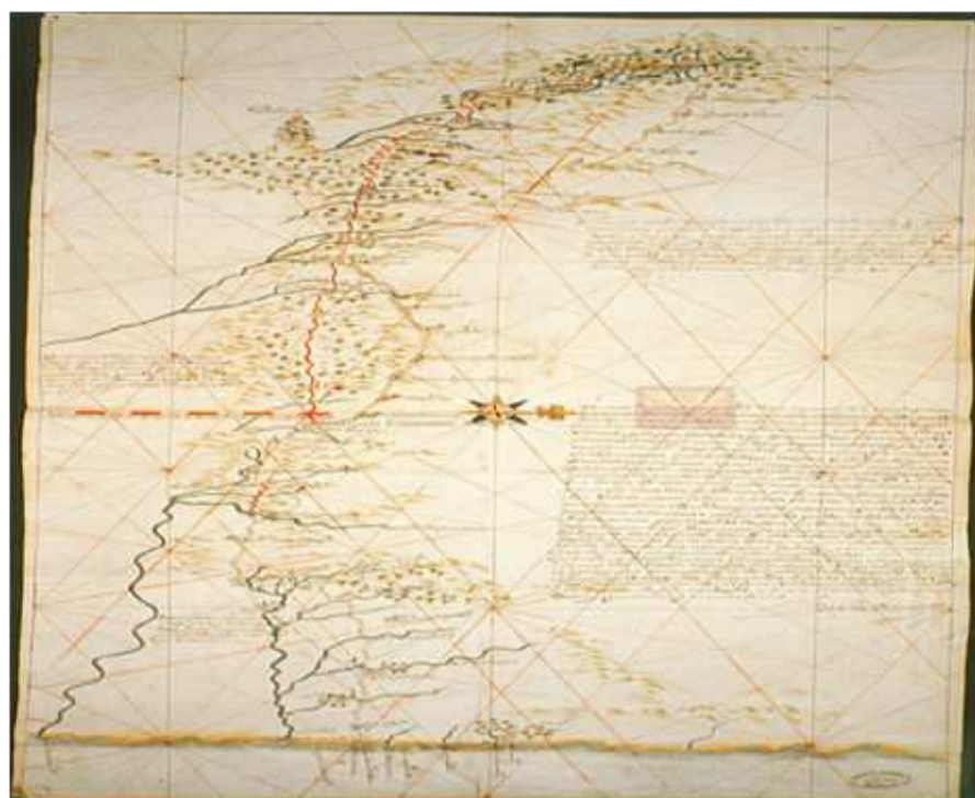
Imagen 4. Dibujo del camino proyectado desde San Juan de Ulúa y las ventas de Buiron hasta México.