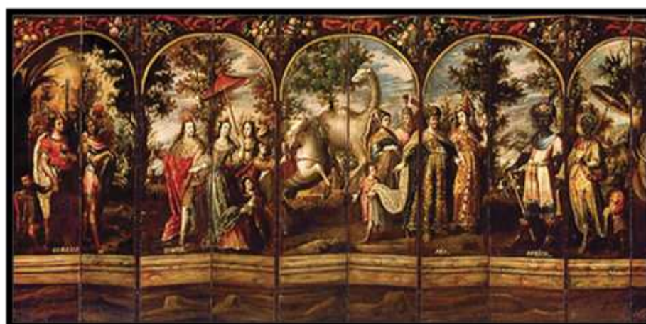
Imagen 1. "Las cuatro partes del mundo", biombo del pintor novohispano de origen mulato Juan Correa (XVII).

Nueva España existía una circulación planetaria que la llevó a construir una modernidad americana, en donde la capital novohispana emergió como una ciudad cosmopolita (Gruzinski, 2004, p. 87), con una producción iconográfica e intelectual que dio origen a las primeras obras del pensamiento moderno americano 4 , el cual se distingue de aquel producido en Europa por poseer una mirada global del mundo que estuvo influenciado por la Monarquía Católica (Gruzinski, 2017, p. 233). Por otra parte, la Nueva España, como territorio conectado a cuatro continentes, produjo sus propias dinámicas sociales y económicas internas, como parte de una originalidad americana, y en este caso, novohispana. (Chakrabarty, 2000)