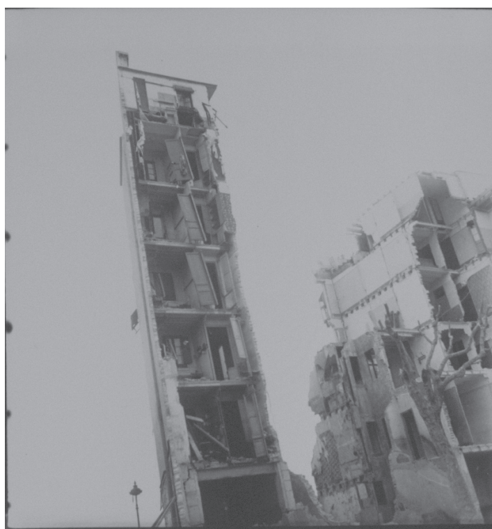
Imagen 148.

Acerca de su conjunto de fotografías de la Academia de San Carlos, hechas en México en 1973, Kati Horna comentaba: “ toda forma está animada por un mensaje mágico. Cada construcción es a la vez que edificio, casa o iglesia, un sueño latente, una actualización de la materia que sin la forma estaría condenada a la nada 13 ”. Se evidencia en esta observación de la fotógrafa una sensibilidad estética especial hacia un aspecto peculiar de los edificios : la relación armoniosa que se suele establecer en ellos entre forma y materia. Para Kati Horna, un edificio no se reduce pues a una funcionalidad como conjunto de viviendas sino que es también el espectáculo puramente visual de una materia hecha forma. En sus fotografías de los espacios urbanos, tanto en París como en España o luego en México, su mirada tiene una acuidad peculiar para, mediante unos enfoques precisos, captar la poesía visual de los edificios, así como el “ sueño latente ” que encierran. En el caso de España, el motivo de las ruinas acentúa esta sensibilidad hacia la relación forma/materia en la medida en que el resultado de los bombardeos rompe su equilibrio armónico. Pero al mismo tiempo, revela de cierta manera su esencia : al haber desaparecido las fachadas, la materia se impone, desnuda. A este respecto, la fotografía n° 148, titulada “ Calle Marina. Bombardeo de marzo ”, sacada en Barcelona después de los bombardeos de marzo del año 1938, es particularmente espectacular.