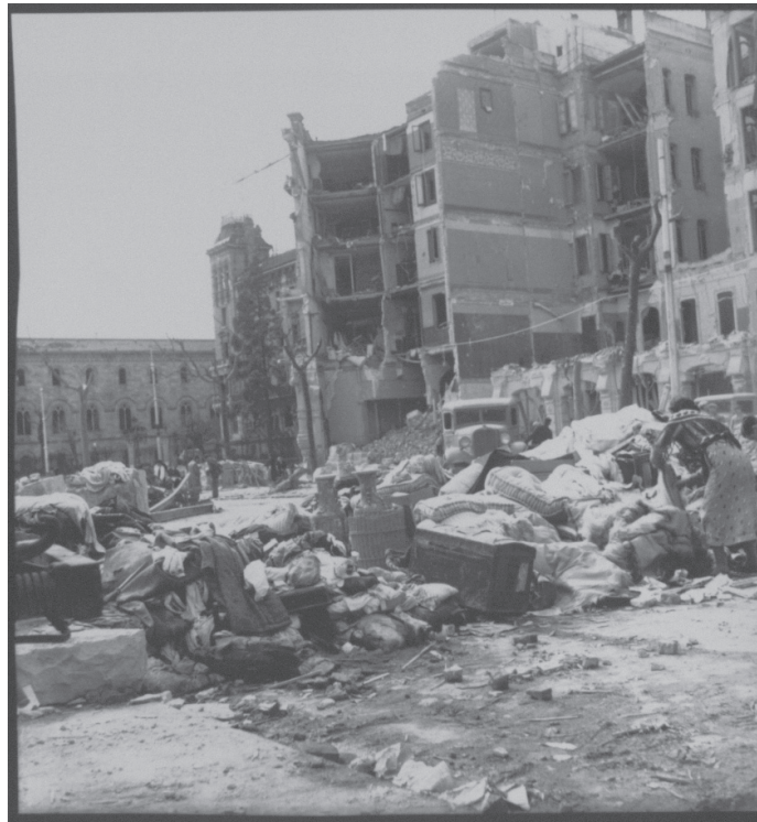
Imagen 179.

si rehúye voluntariamente de cualquier representación de la violencia en acto, no por ello es ausente la violencia de sus fotografías. En efecto, se presenta en ellas mediante una función metonímica que se asienta en un arte de la metalepsis, una figura retórica que suele expresar la causa por la consecuencia, y viceversa. El espectáculo de las ruinas presentes se concibe entonces como la consecuencia de los bombardeos pasados que las imágenes designan in absentia . Observemos, por ejemplo, la fotografía n° 179 titulada “ Casas bombardeadas ” (sin fecha, sin lugar), muy parecida a la anterior, por la manera en que se estructura en ella el espacio fotográfico, dividido en una parte inferior (el de la calle) y una parte superior (los edificios) que el tipo de encuadre elegido, en gran plano, permite abrazar conjuntamente.