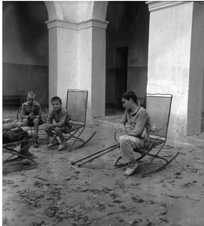
Imagen 162.

La foto 162 nos muestra a unos niños sentados, posiblemente descansando después del juego. El suelo de arena está lleno de garabatos. Uno de ellos lleva un palo en la mano, sin duda ha dibujado con él. Otro tiene unas muletas apoyadas en el suelo. También han debido servir para el juego. Cuando nuestra mirada, después de haber atendido el conjunto, recorre los detalles de la imagen y sigue el itinerario que va de las muletas hacia el niño, descubrimos que le falta una pierna. Entonces, el juego revela una trágica amputación, una violenta irrupción del mundo adulto. La guerra está inscrita en la imagen, pero ya con otra temporalidad. Es, como indicábamos más arriba, el tiempo de lo cotidiano cortocircuitado, segado, donde aún late con fuerza el acontecimiento.