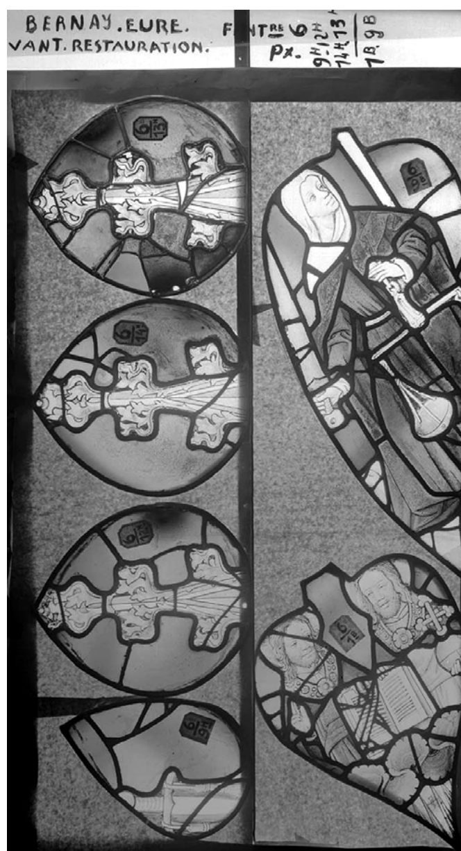
Fig. 2 : Vitrail de Notre-Dame-de-la-Couture à Bernay (baie 9), clichés pris avant restauration, vers 1939-1945