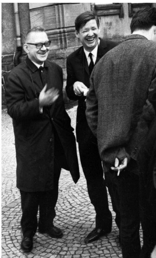
Fig. 1 : Louis Grodecki et Willibald Sauerländer avec leurs étudiants devant la cathédrale de Spire, 1966, Zentralinstitut für Kunstgeschichte, Munich, photo Monika Steinhauser.

S'il fut particulièrement heureux à Strasbourg de 1961 à 1969, ce n'était pas seulement parce qu'il trouvait enfin au bord du Rhin, un milieu, une audience. C'est surtout parce qu'il se trouvait entre les deux mondes auxquels il était attaché par tout son être. [...] Grodecki fut appelé en 1961 à enseigner à Strasbourg, il me raconta au cours d'une conversation à Marbourg qu'il avait déclaré aux autorités : « Que ce soit un pont vers l'Allemagne, je veux bien ; si ce doit être au contraire une forteresse contre les barbares, ce n'est pas pour moi. » J'enseignai moi-même à partir de 1962 de l'autre côté du Rhin, à Fribourg-en-Brigau. Nous eûmes alors les contacts les plus simples du monde : visites, voyages d'étude avec les étudiants. Tout cela sans aucune organisation officielle ou administrative. Tout le monde, je crois, en était très heureux. J'ai toujours gardé le sentiment que les étudiants fribourgeois, pour qui Grodecki était devenu comme un de « leurs » professeurs, car les accueillant et que, c'étaient nous, ces étudiants et moi-même, qui dans cet extraordinaire échange au cœur du monde rhénan, en avions tout le bénéfice. [fig. 1]