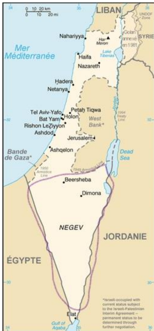
(Carte 2 : le désert palestinien se trouve dans toute la partie sud) 8

Le parler des réfugiés, malgré sa proximité de l'arabe parlé dans les villages ou dans les villes voisines, est tout de même différent. Par exemple, un réfugié habitant au camp de réfugiés d'Al-Fawwar parle une glosse proche de celle parlée à Dura, le village proche (cf. carte 3).