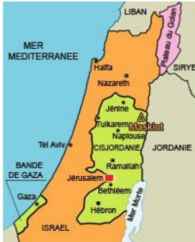
(Carte 1 : Les parties en vert sont considérées comme étant les Territoires Palestiniens) 7

linguistique palestinienne telle qu'elle est utilisée dans les Territoires Palestiniens, en raison de l'influence de la langue du pays de naissance. Par exemple, les enfants de Palestiniens partis en Algérie dans les années 1980 parlent une variété linguistique algérienne, ou font un mélange entre le palestinien et l'algérien. Ainsi, pour étudier et analyser le dialecte palestinien, il a été nécessaire de constituer un corpus de Palestiniens nés et vivant dans les Territoires Palestiniens.