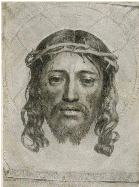
Fig. 9. Claude Mellan, [La Sainte Face] Formatur unicus una , burin, 2 e état, 43,5x30,4 cm, 1649. BnF, Estampes, Réserve Ed-32 (B)-Fol

Il avoit encore cecy de particulier, que les choses qu'il avoit gravées avoient plus de feu, plus de vie & plus de liberté, que le Dessein mesme qu'il imitoit, contre ce qui arrive à tous les autres Graveurs, dont les Ouvrages sont toujours moins vifs & moins animez que le Dessein ou le Tableau qu'ils copient 24 [...].