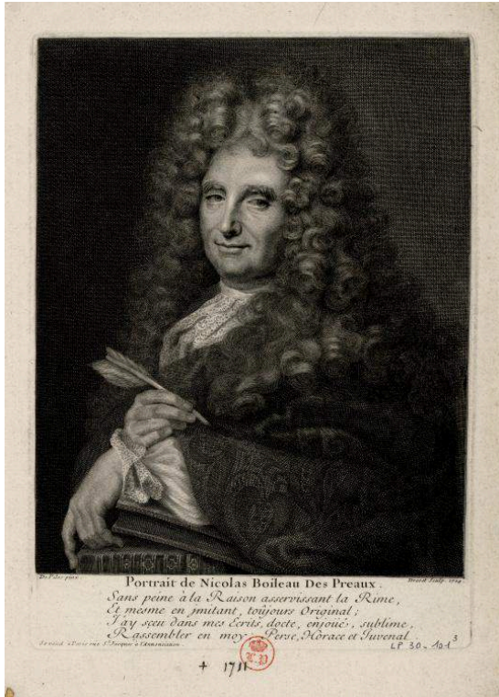
Fig. 4. Pierre Drevet d'après Roger de Piles, Portrait de Boileau-Despréaux à mi-corps , burin, 25,1x18,6 cm, 1704. Château de Versailles, n° inv : INV.GRAV.LP 30.101.3