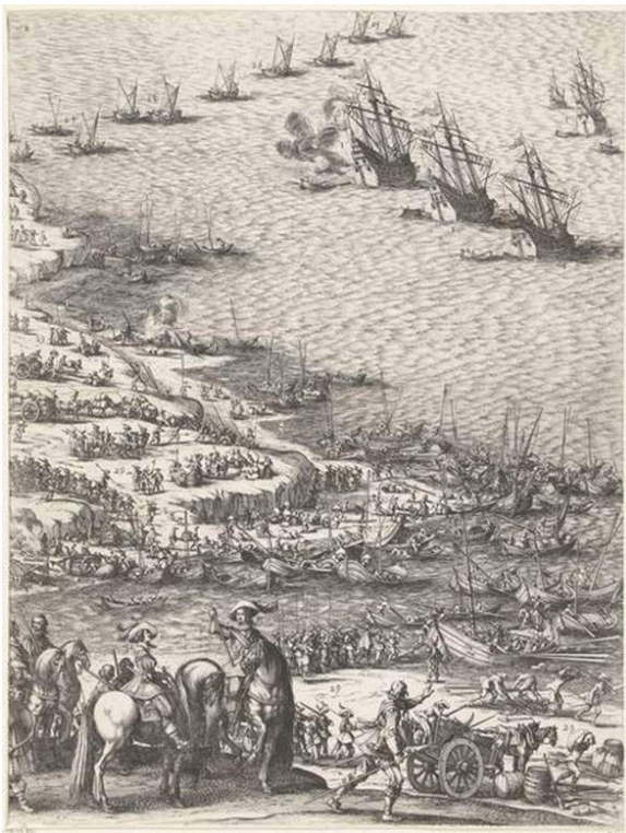
Fig. 8. Jacques Callot, Le Siège de Saint-Martin-de-Ré (fragment) , eau-forte, 57,2x43,5 cm, 1629-1631. Amsterdam, Rijksmuseum, RP-P-OB-56.871

Il grava aussi estant en France trois Sieges fort memorables, celuy de S. Martin de Ré, celuy de Breda & celuy de la Rochelle. Sur le devant les Figures sont d'une grandeur assez considerable, & dans l'esloignement elles sont d'une petitesse presque imperceptible & cependant aussi distinguées & aussi reconnaissables que si elles n'estoient qu'à quinze ou vingt pas 13 (fig. 8).