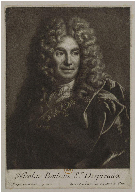
Fig. 5. André Bouys, Nicolas Boileau-Despréaux , manière noire, 17x12,9 cm, 1702. BnF, Estampes, AA-3 (Bouys, André)