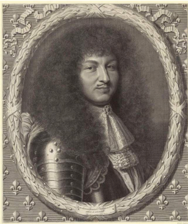
Fig. 10. Robert Nanteuil, Portrait de Louis XIV en armure , burin, 7 e état, 68,7x58,2 cm, 1672. BnF, Estampes, Réserve AA-5 (Nanteuil, Robert)