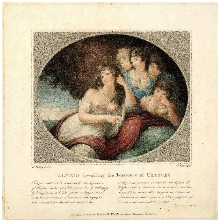
Fig. 1. William Nutter d'après Samuel Shelley, Calypso déplorant le départ d'Ulysse , stipple imprimé en couleurs, 20,2x20 cm, 1780. Londres, British Museum, 1872,0511.297. La lettre cite un extrait du livre I des Aventures de Télémaque de Fénelon