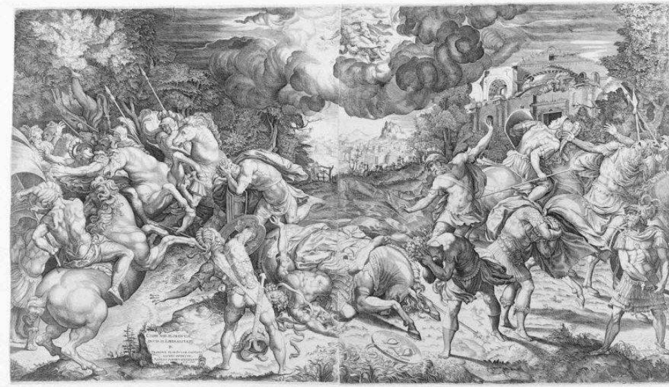
Fig. 6. Enea Vico d'après Francesco Salviati, La Conversion de saint Paul , burin en deux planches, 54,2x94,8 cm, 1545. BnF, Estampes, Réserve AA-6 (Vico, Enea)