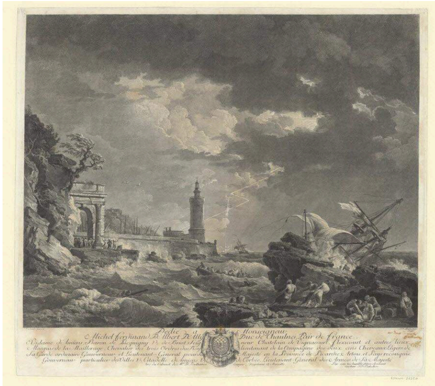
Fig. 3. Jean-Joseph Baléchou d'après Joseph Vernet, La Tempête , état ii/iv, eau-forte et burin, 50,5x56,8 cm, 1757 (Paris, BnF, Estampes, Réserve AA-5 (Baléchou, Jean-Joseph))