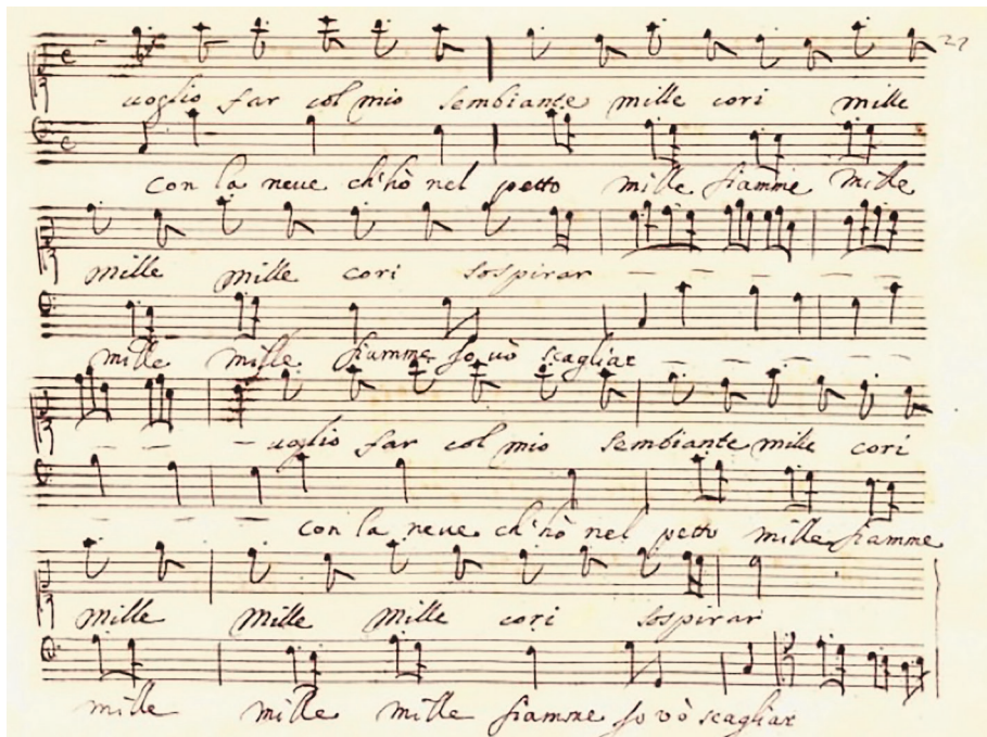
2. Antonio Sartorio, Giulio Cesare in Egitto , ms, I-Nc Rari 6.4.15, f. fol. 27, Naples, Conservatoire Sans Pietro a Najella

fiammeggiante / Cento amanti lagrimar 7 . » La musique souligne les propos du texte, notamment le mot sospirar , qui fait l'objet d'une longue vocalise en rythme pointé (fig. 2) :